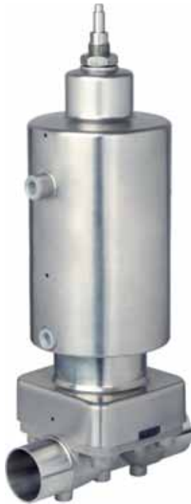
DN 50 Cf. 4